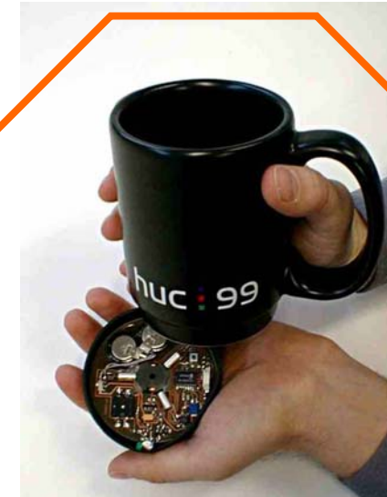
Die Zukunft: Überall Computer