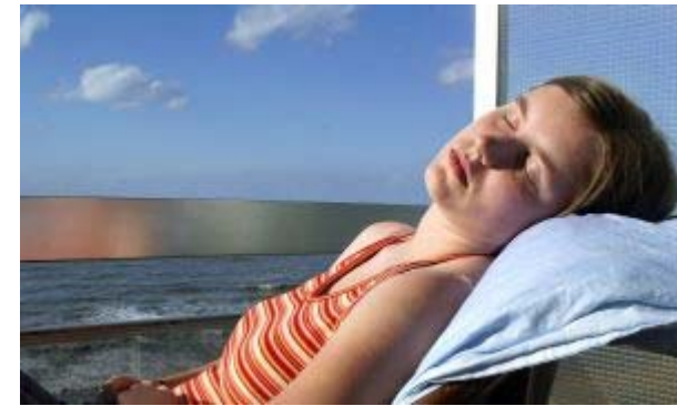
Beim Entspannen: Kein Klingeln, ...

Und all das komplett automatisch, ohne direkte Benutzer-Interaktion!