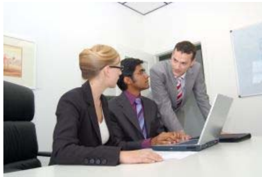
Im Business-Meeting: Vibrationsalarm