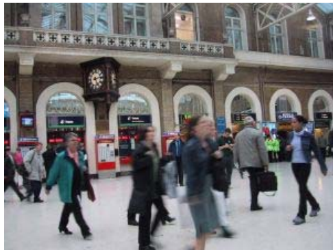
Auf dem Bahnhof: Normales Klingeln