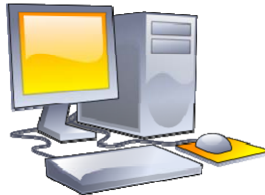
Das letzte Jahrzehnt: Desktop PCs